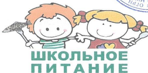
График посещения столовой МАОУ – СОШ с.Ягодного Асиновского района Томской области